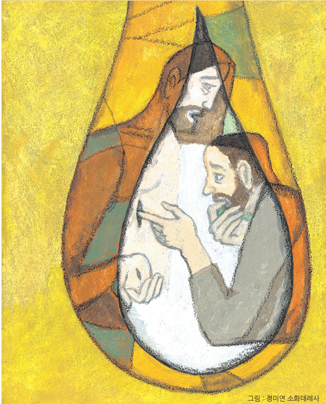
그림 : 정미연 소화데레사

2019년 교구장 사목교서 - “믿음은 들음에서 옵니다.”(로마 10,17)